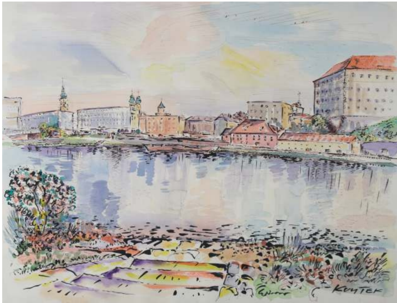
Linz Donaulände, Feder, Aquarell, Tusche / Papier, 50x65cm