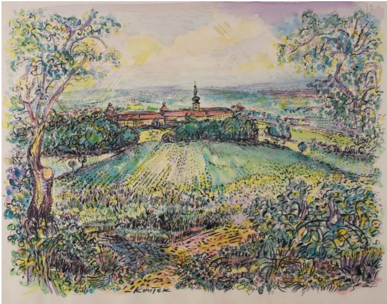
Stift Seitenstetten, Feder, Aquarell, Tusche / Papier, 50x65cm