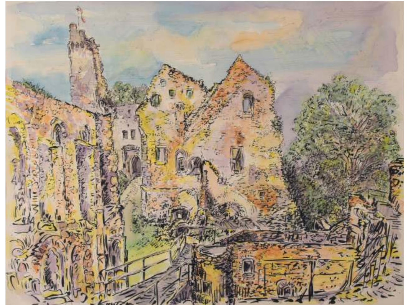
Schaunburg, Feder, Aquarell, Tusche / Papier, 50x65cm