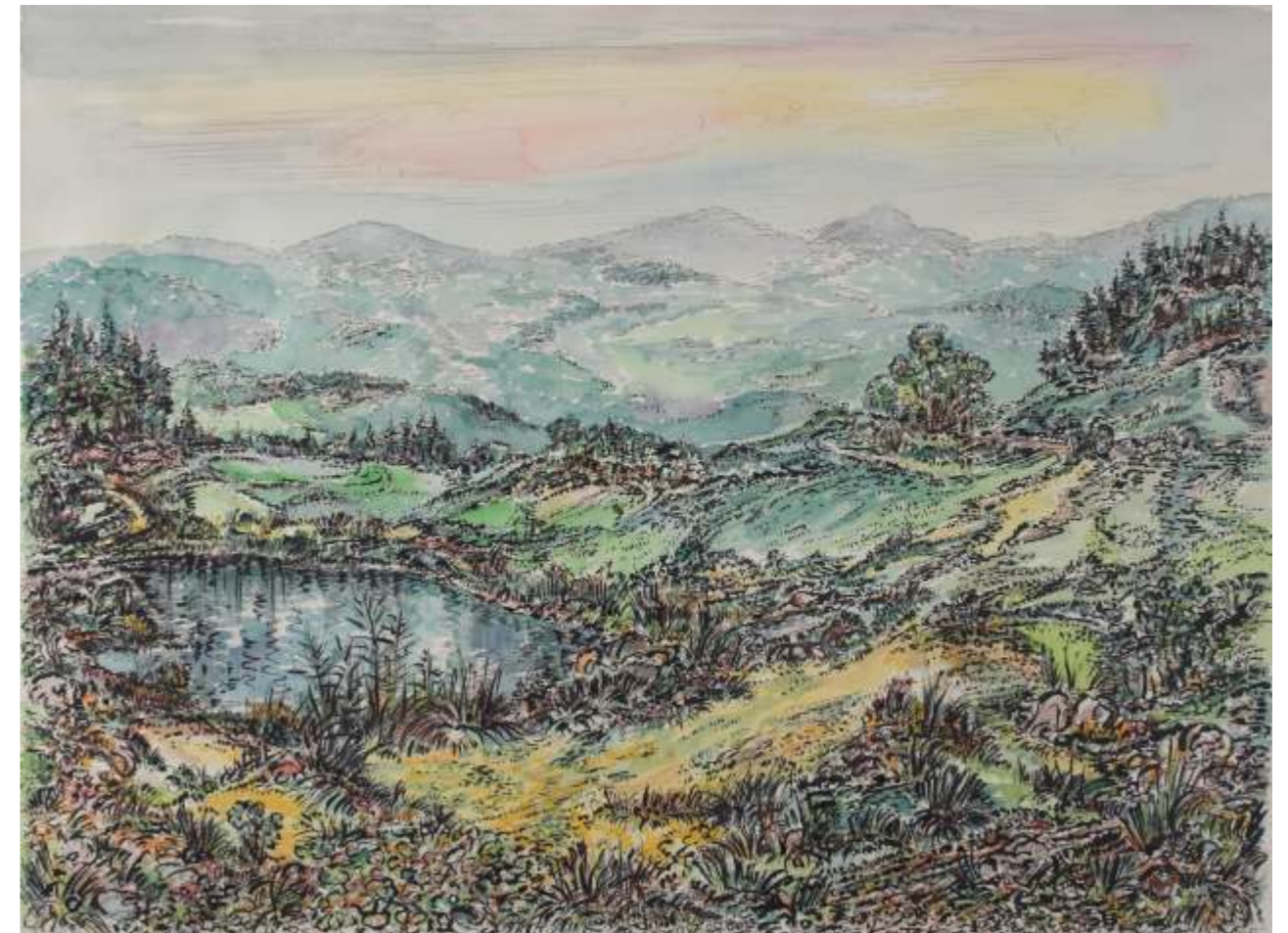
Landschaft, Feder, Aquarell, Tusche / Papier, 50x65cm