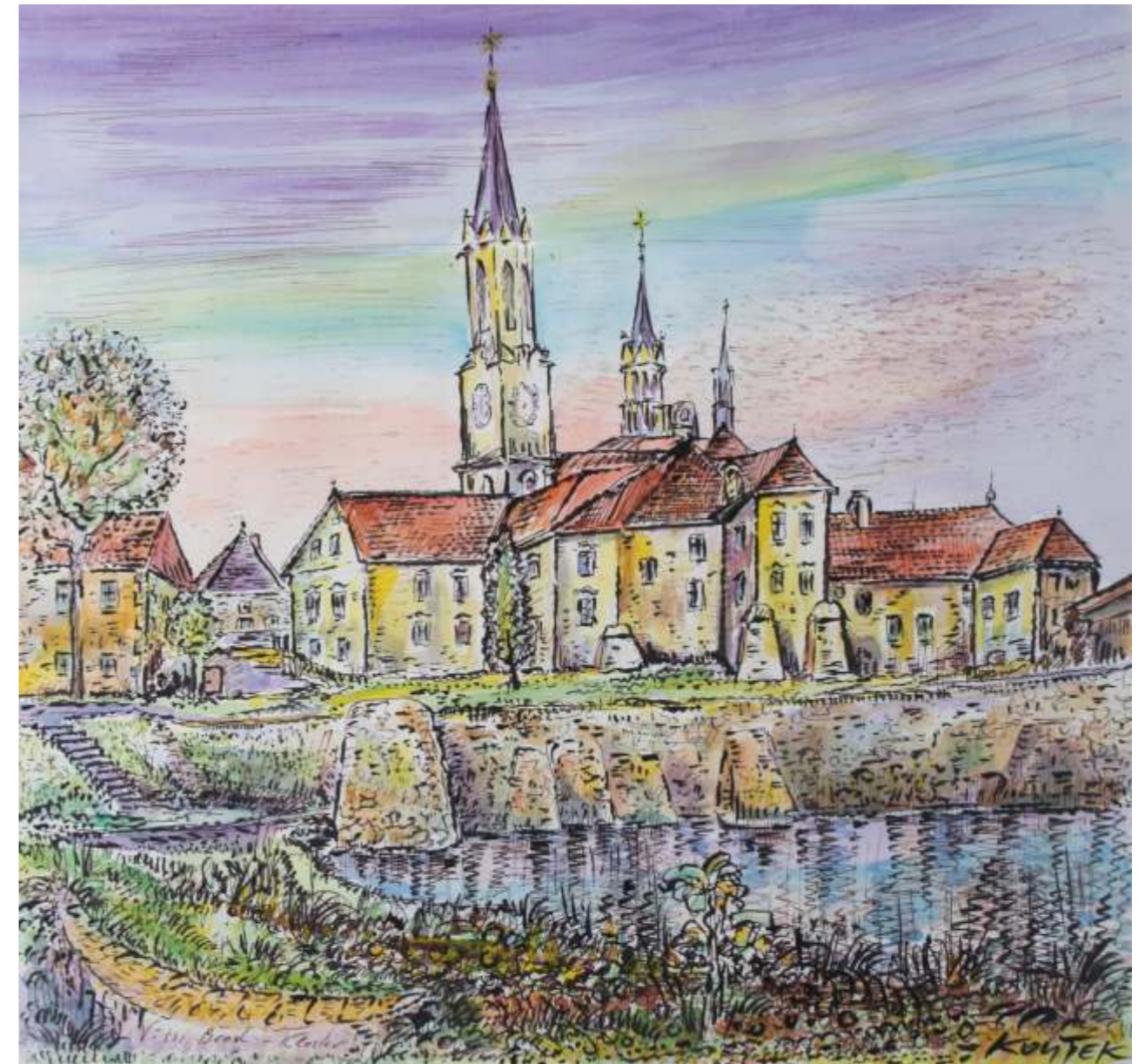
Kloster Vissi Brod, Feder, Aquarell, Tusche / Papier, 60x65cm