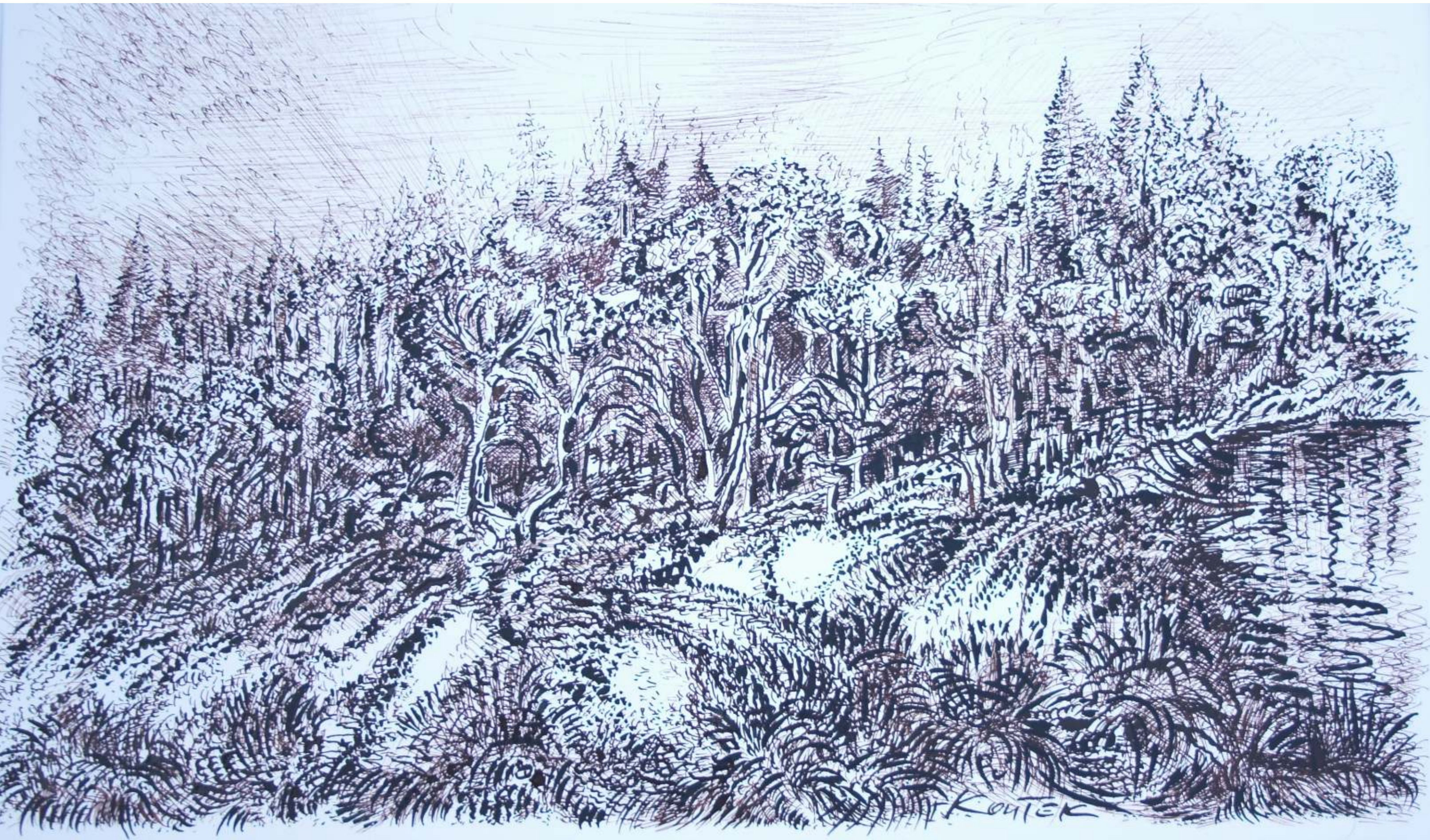
Waldsaum, Feder, Aquarell, Tusche / Papier, 50x35cm