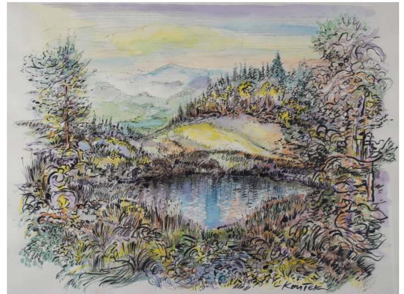
Nixenteich, Feder, Aquarell, Tusche / Papier, 50x65cm