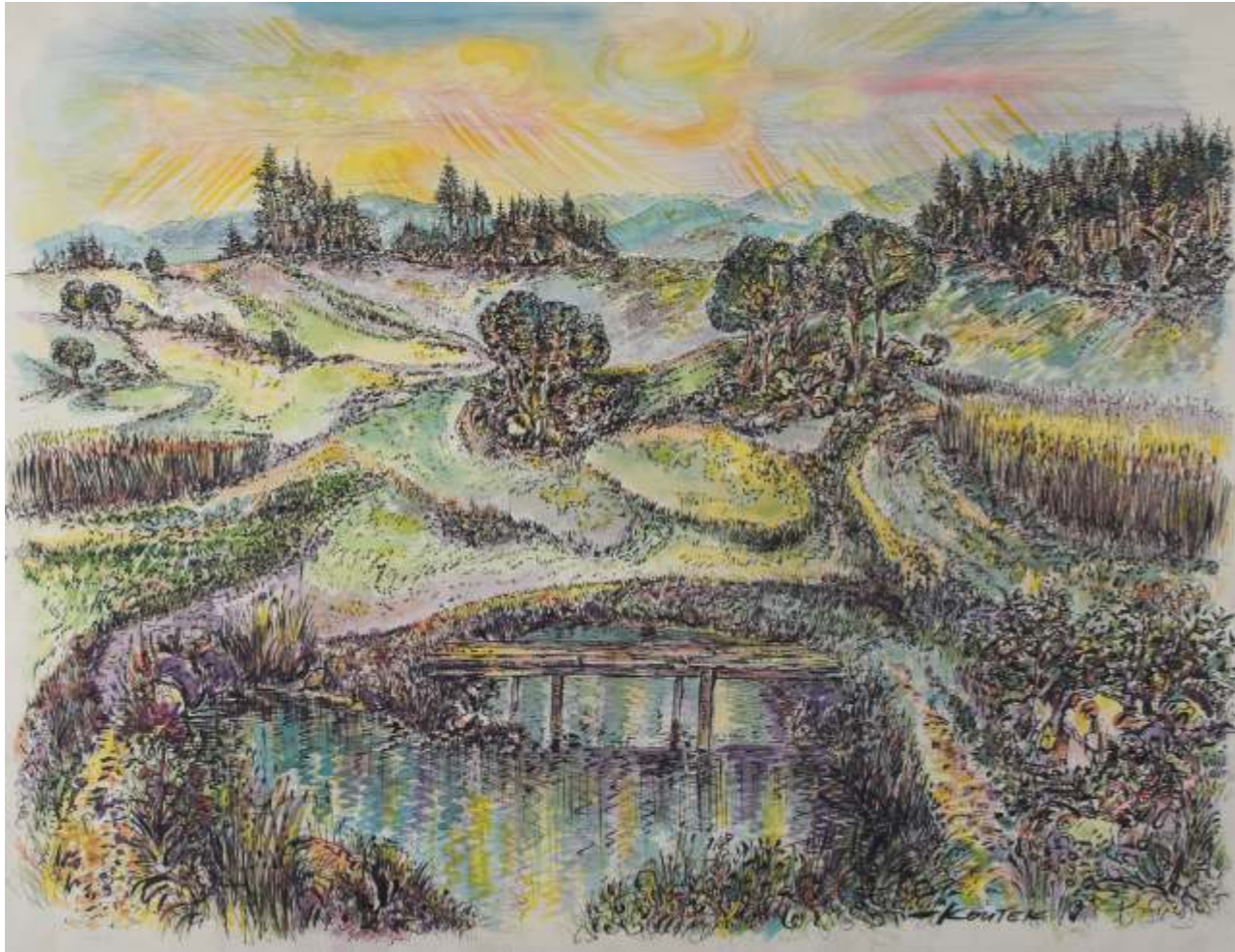
Landschaft, Feder, Aquarell, Tusche / Papier, 50x65cm